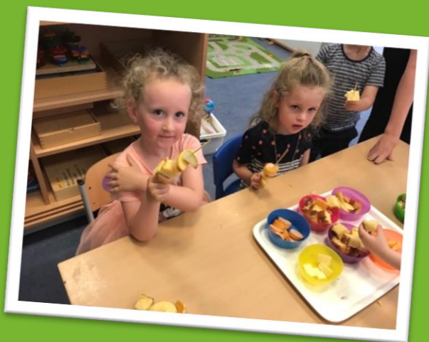
PSG: Etenswaren rijgen, net als rupsje Nooitgenoeg!

Genoeg te doen en te beleven op misschien wel de leukste kinderopvang!