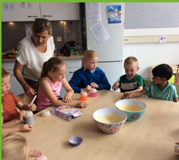
NSO: Cupcakes bakken

Christelijk kindcentrum Juliana kinderopvang & basisonderwijs