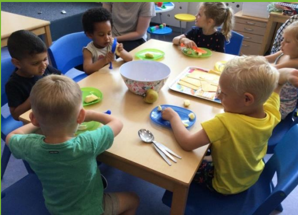
PSG: Appelflappen bakken!

Genoeg te doen en te beleven op misschien wel de leukste kinderopvang!